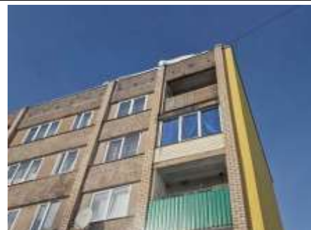
Dzīvokļa Nr.9 lodžija