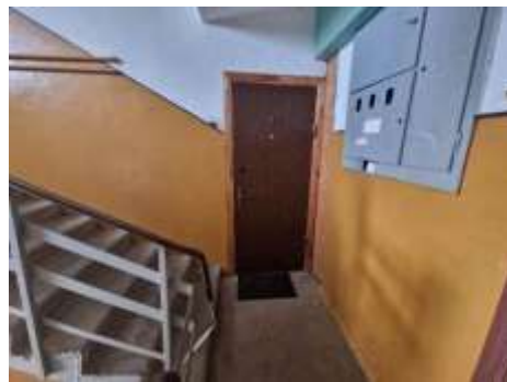
Dzīvokļa Nr.9 ieejas durvis