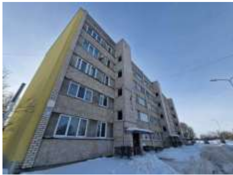
Dzīvojamā māja Kalkūnes ielā 14