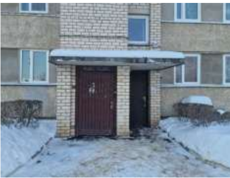
Ieeja kāpņu telpā