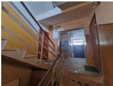
1.stāva kāpņu telpa