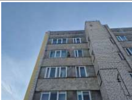
Dzīvokļa Nr.9 logi