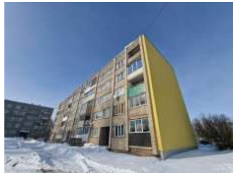
Dzīvojamā māja Kalkūnes ielā 14