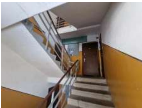
4.stāva kāpņu telpa